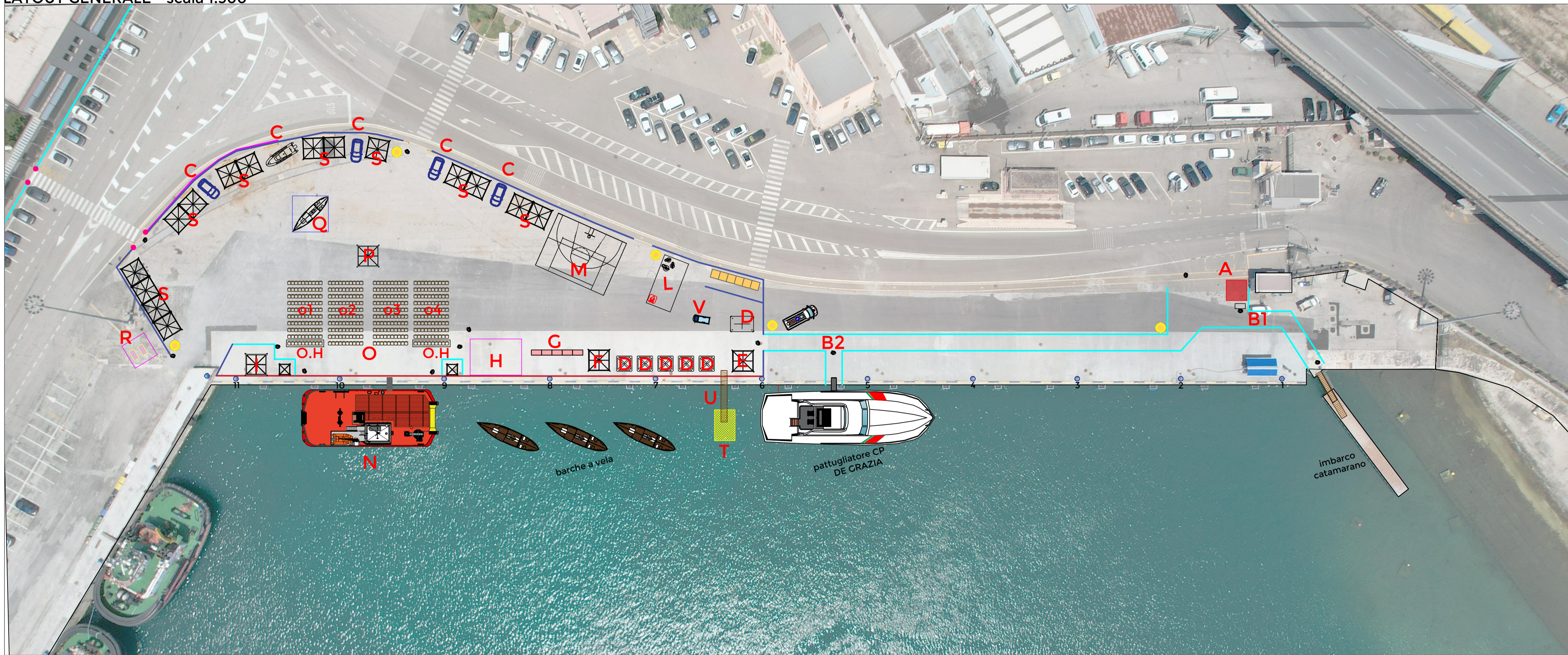
LAYOUT GENERALE - scala 1:300